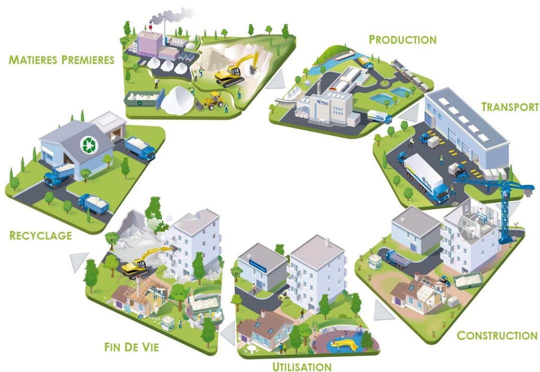
Schéma du cycle de vie